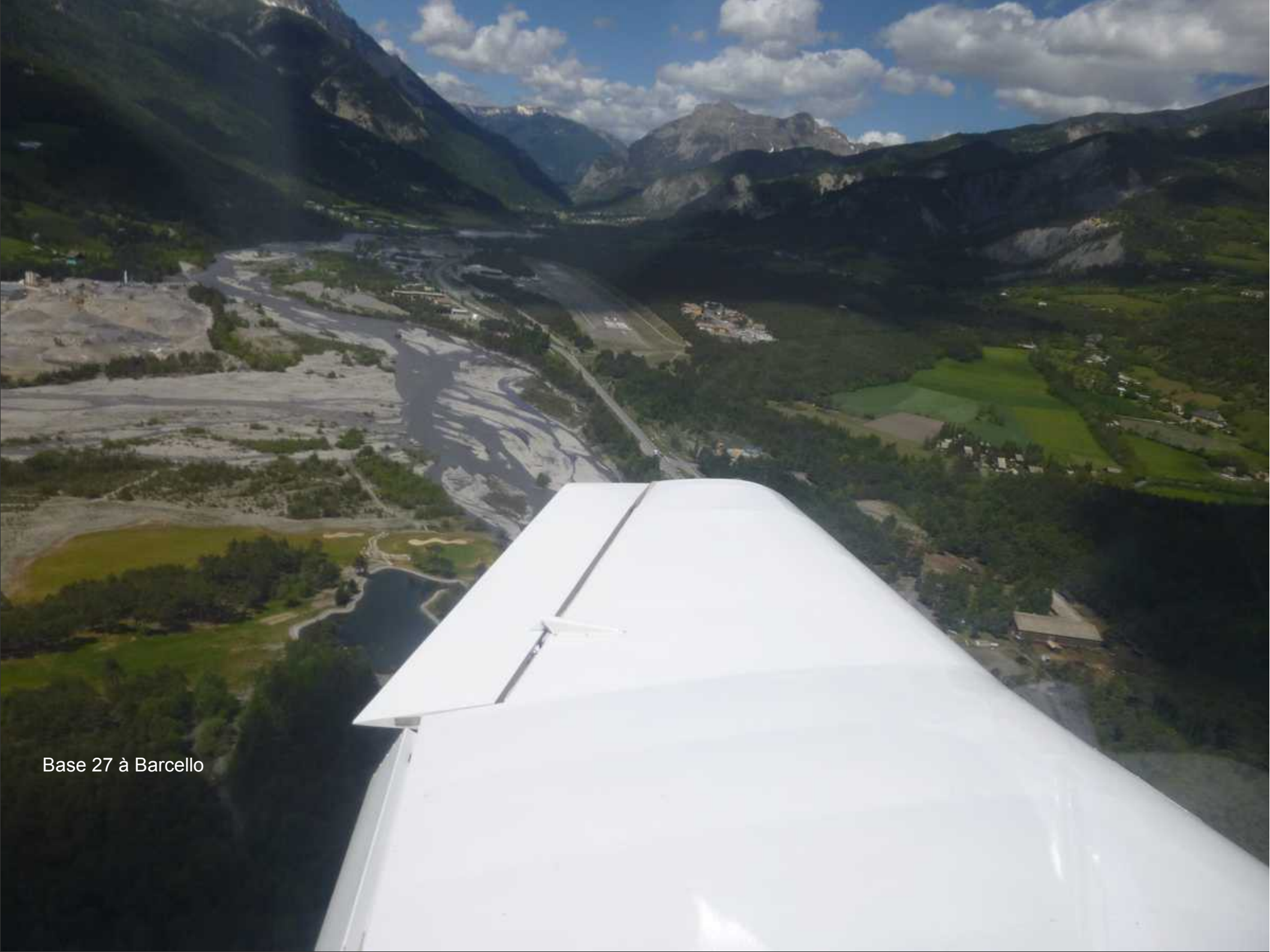
Base 27 à Barcello