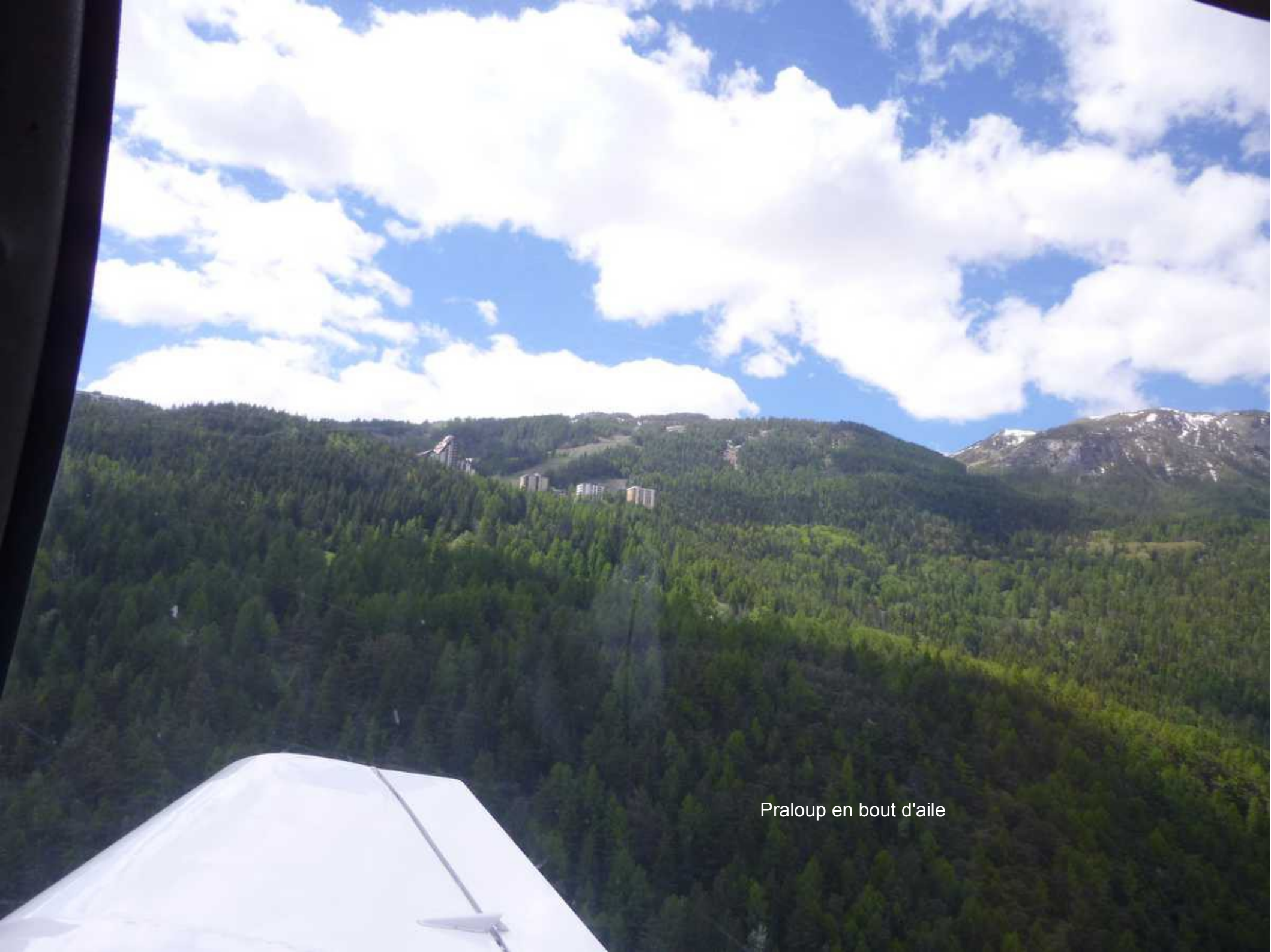
Praloup en bout d'aile