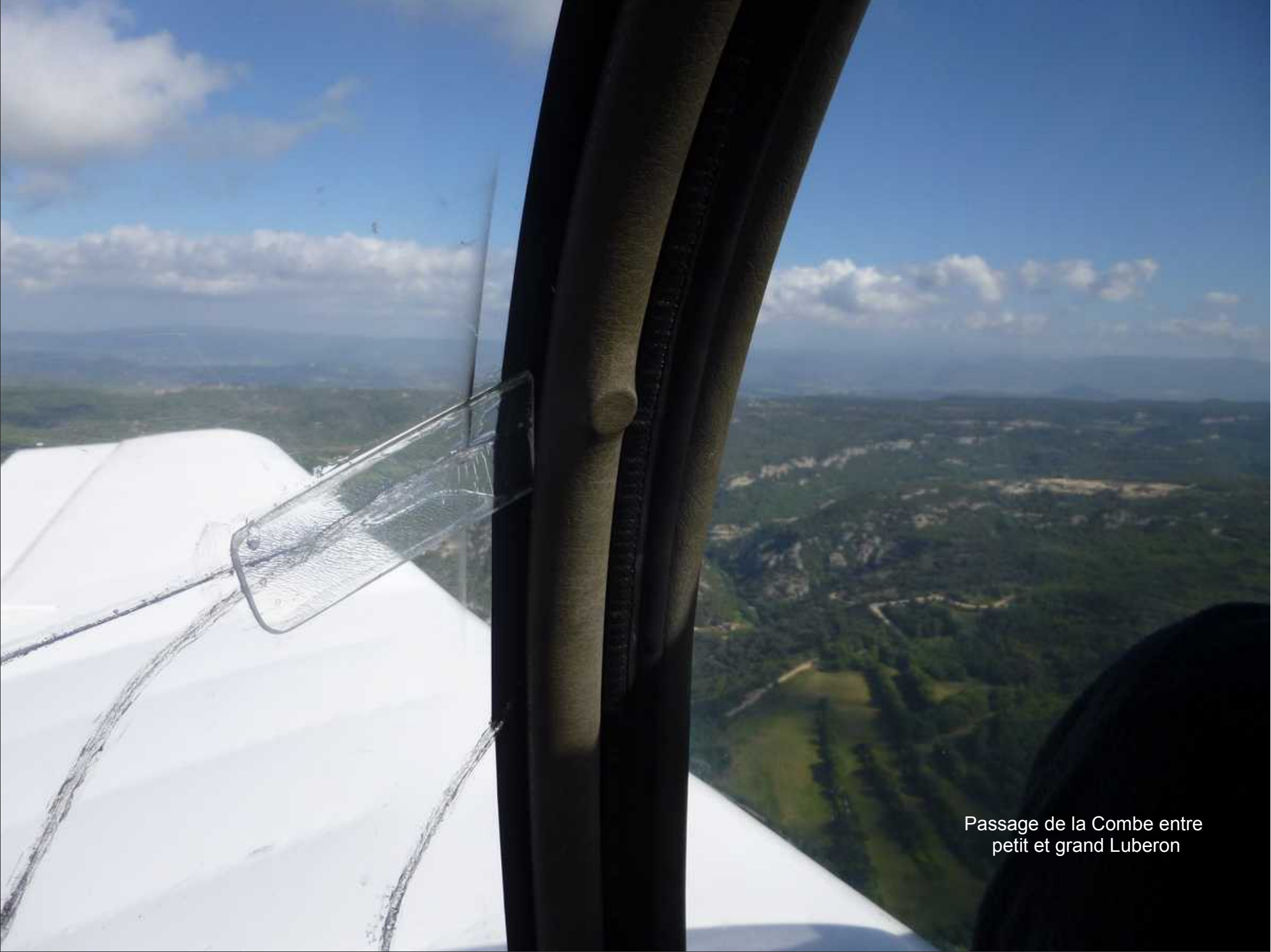
Passage de la Combe entre petit et grand Luberon