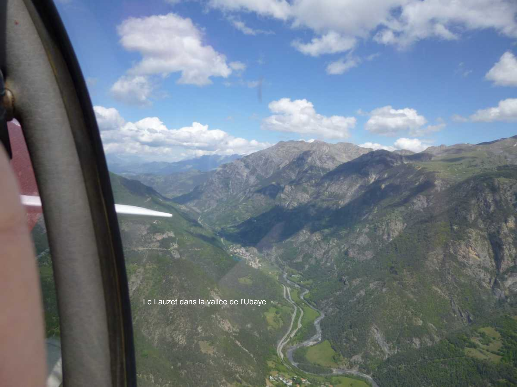
Le Lauzet dans la vallée de l'Ubaye