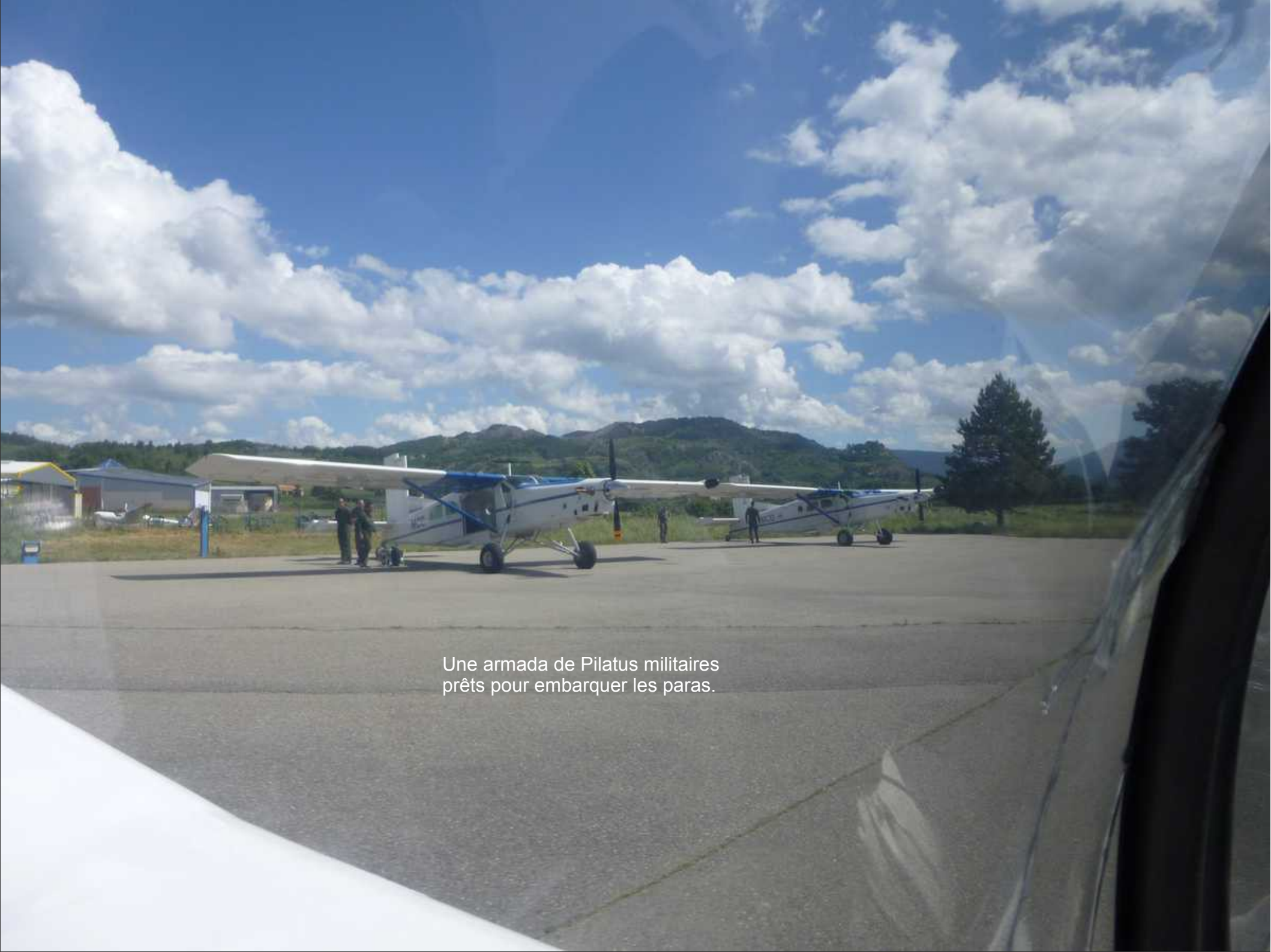
Une armada de Pilatus militaires prêts pour embarquer les paras.