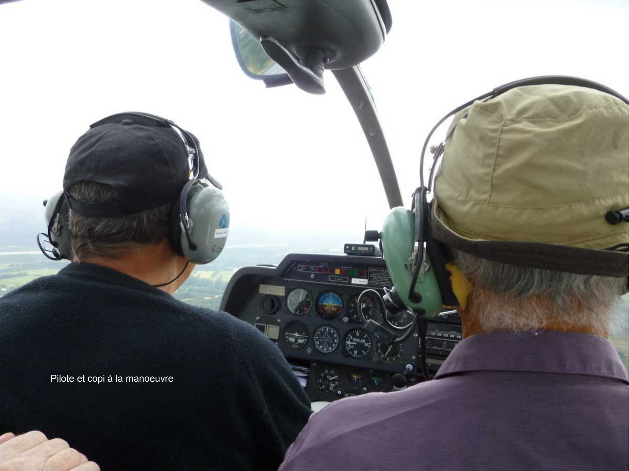
Pilote et copi à la manoeuvre