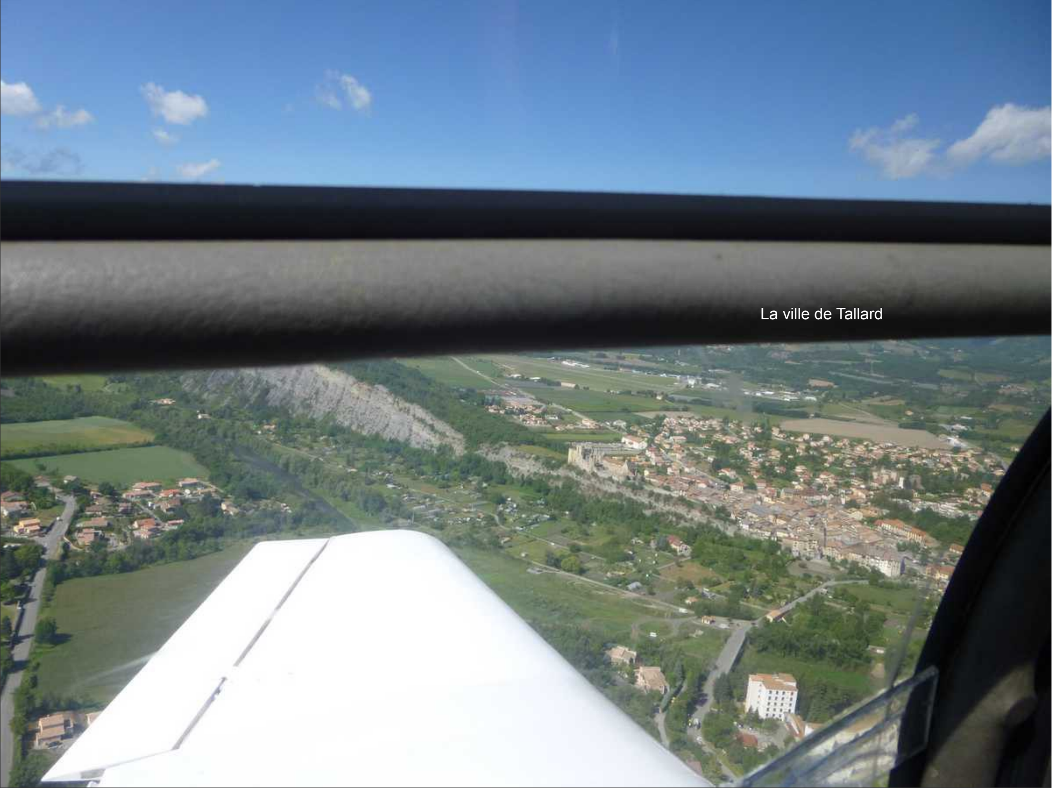
La ville de Tallard