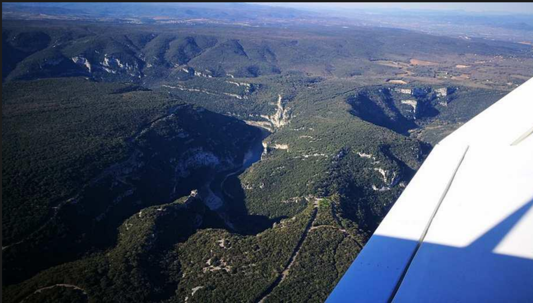
L'Ardèche , à suivre jusqu'à Aubenas