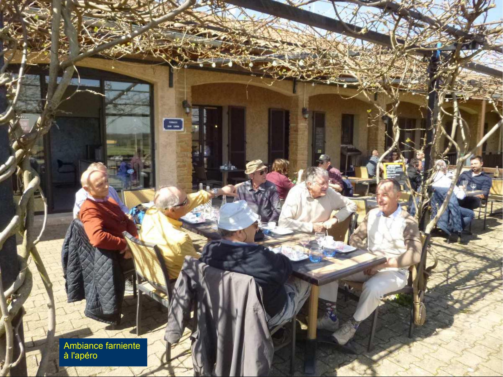
Ambiance farniente à l'apéro