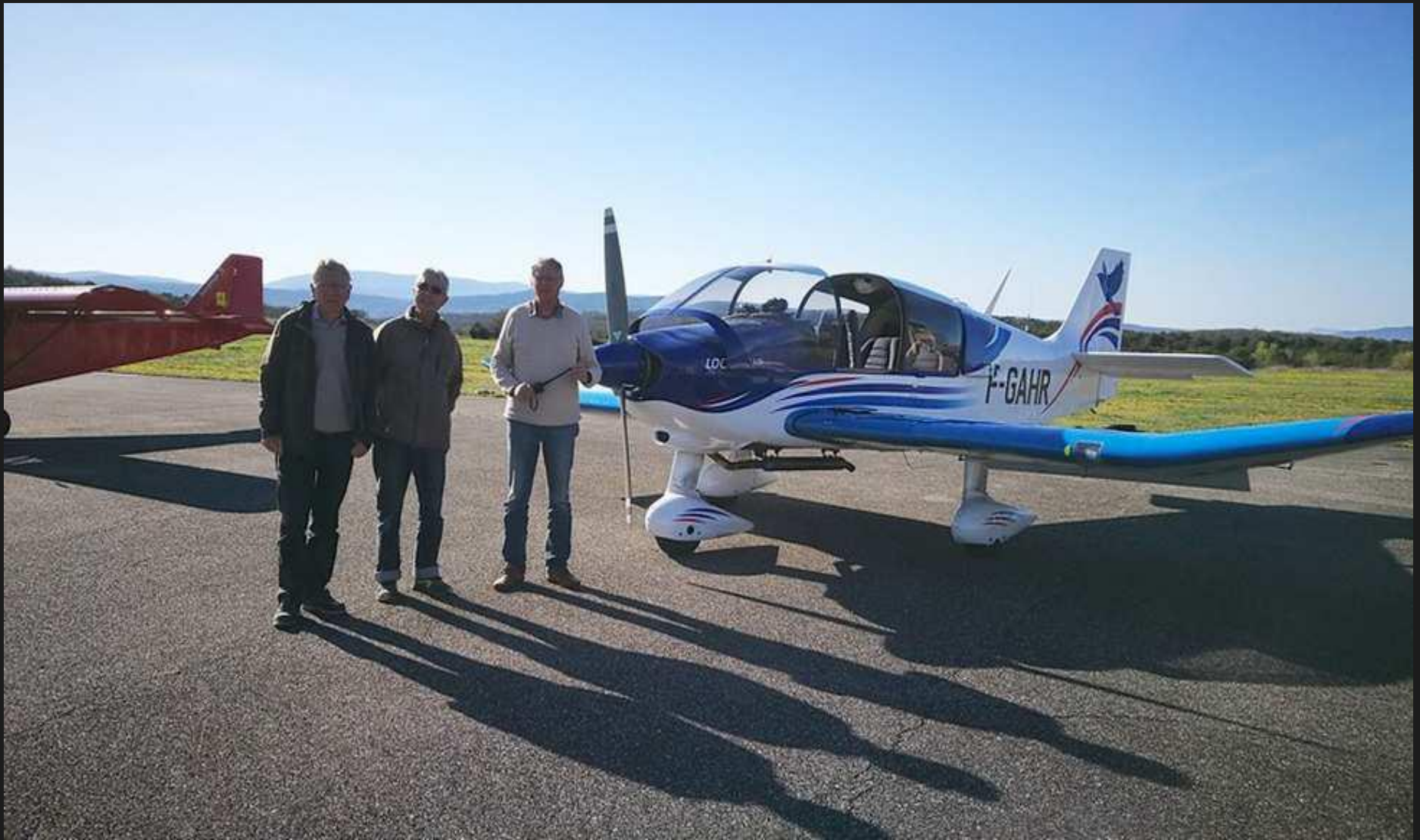
HR et une partie de l'équipage sur le tarmac d'Aubenas.