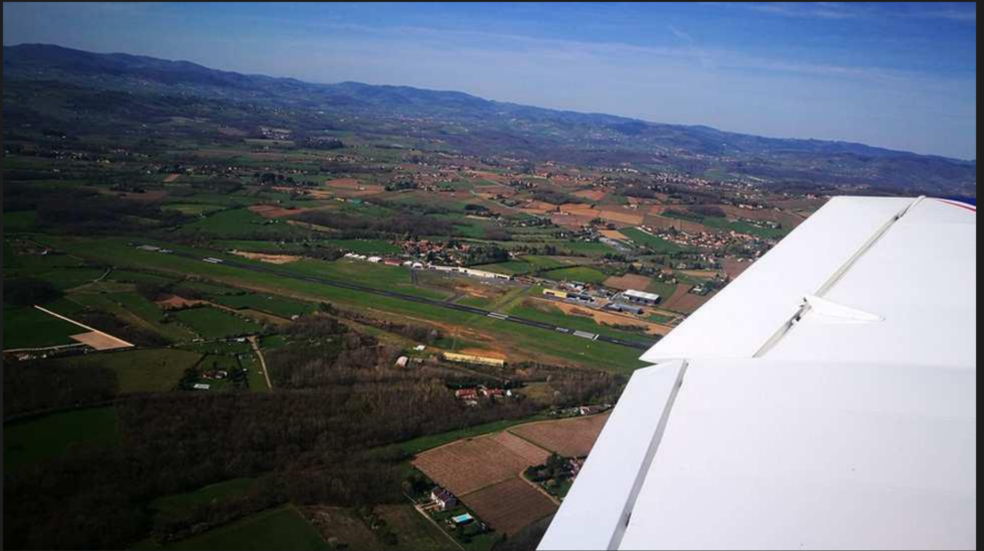
Vent arrière 18 à Villefranche Tarare.