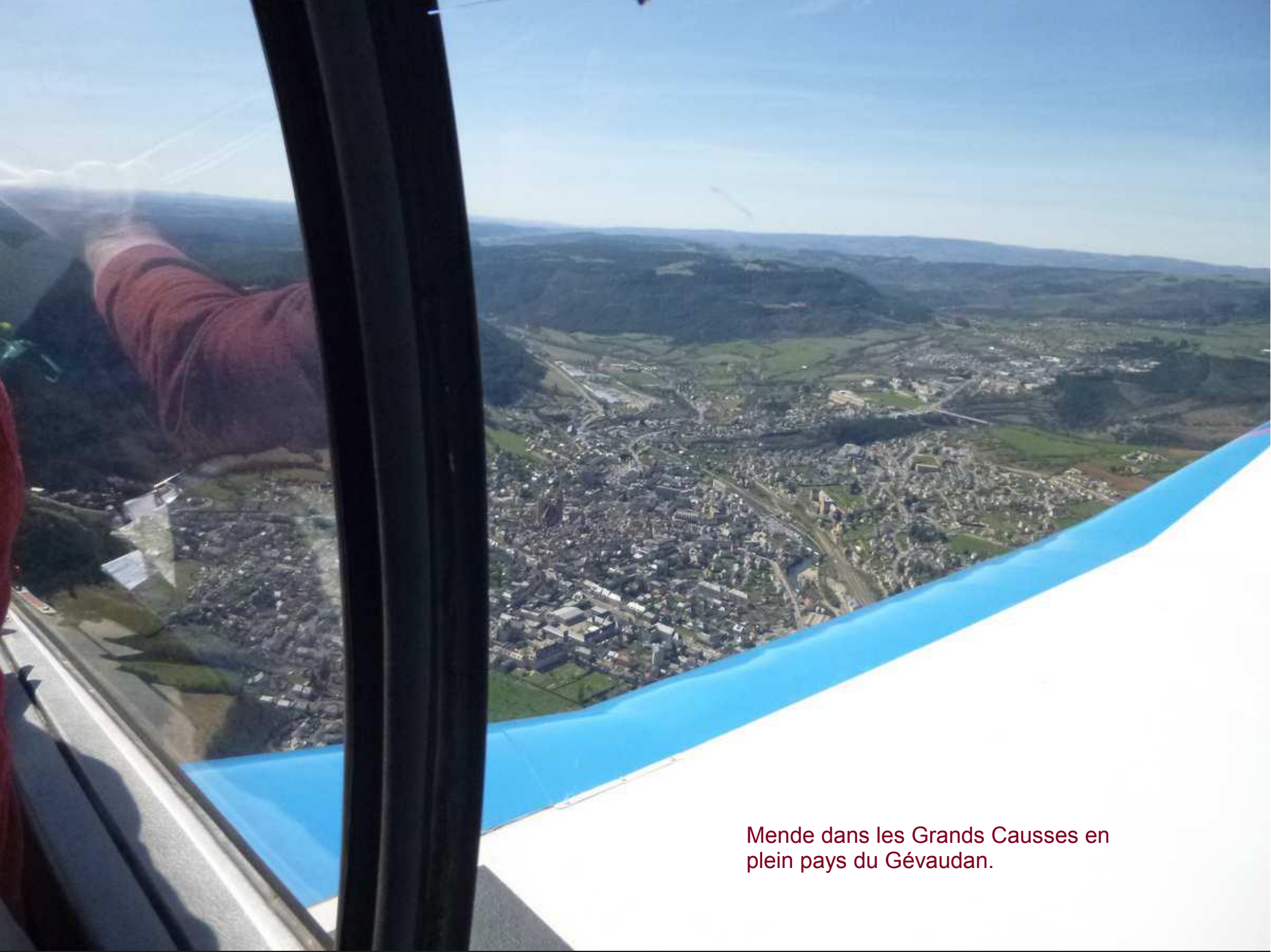
Mende dans les Grands Causses en plein pays du Gévaudan.