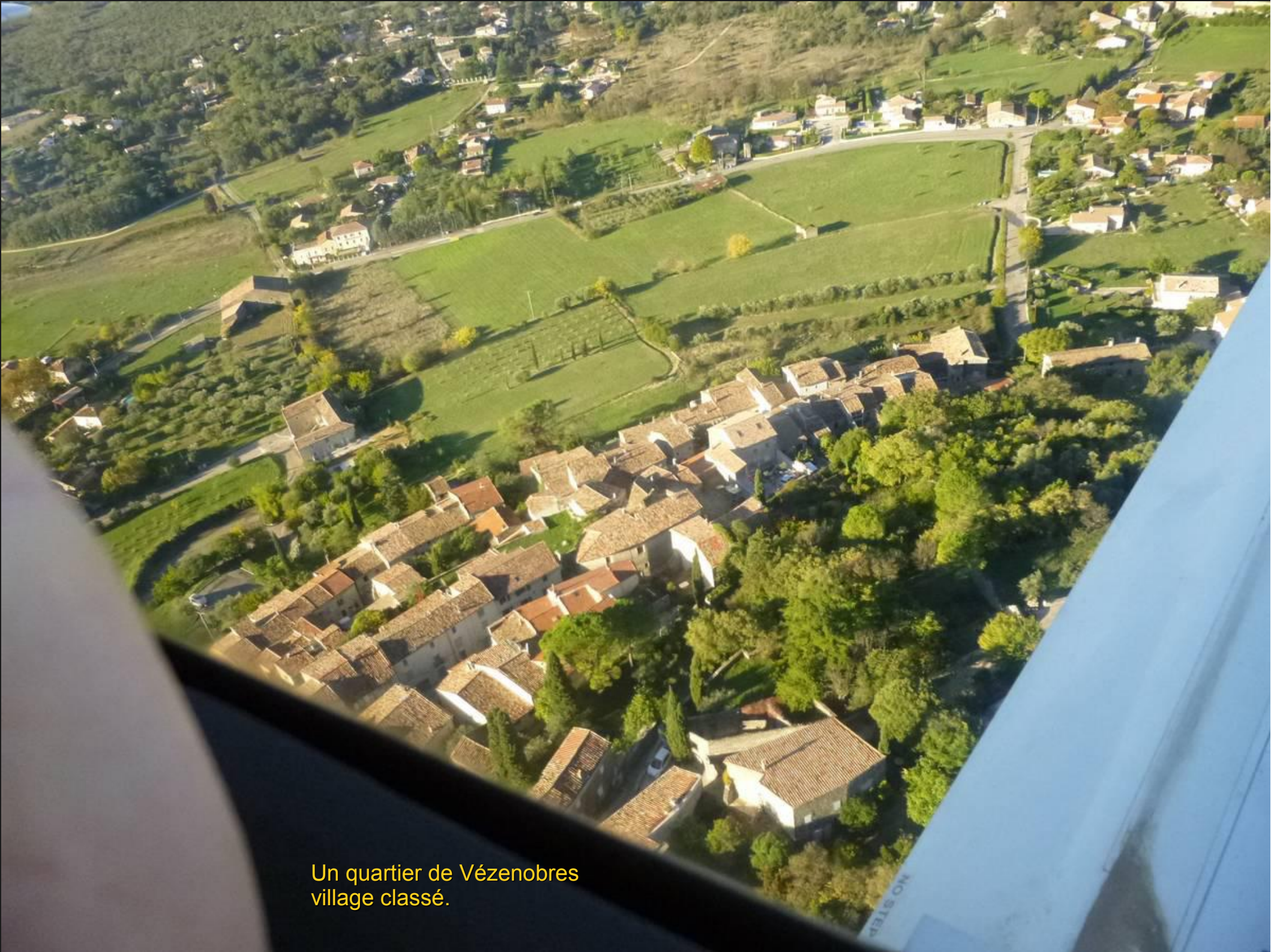
Un quartier de Vézenobres village classé.