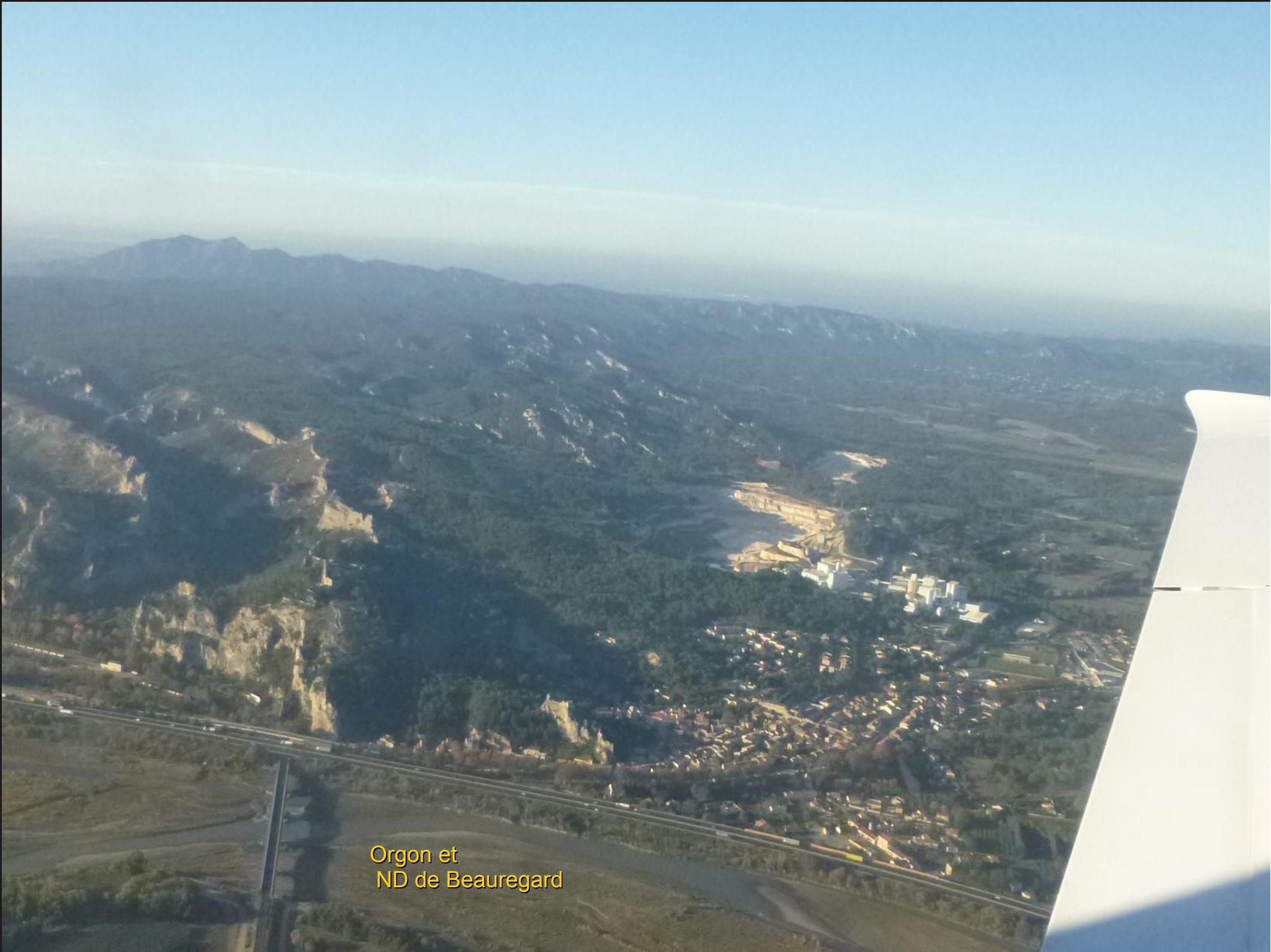
Orgon et ND de Beauregard