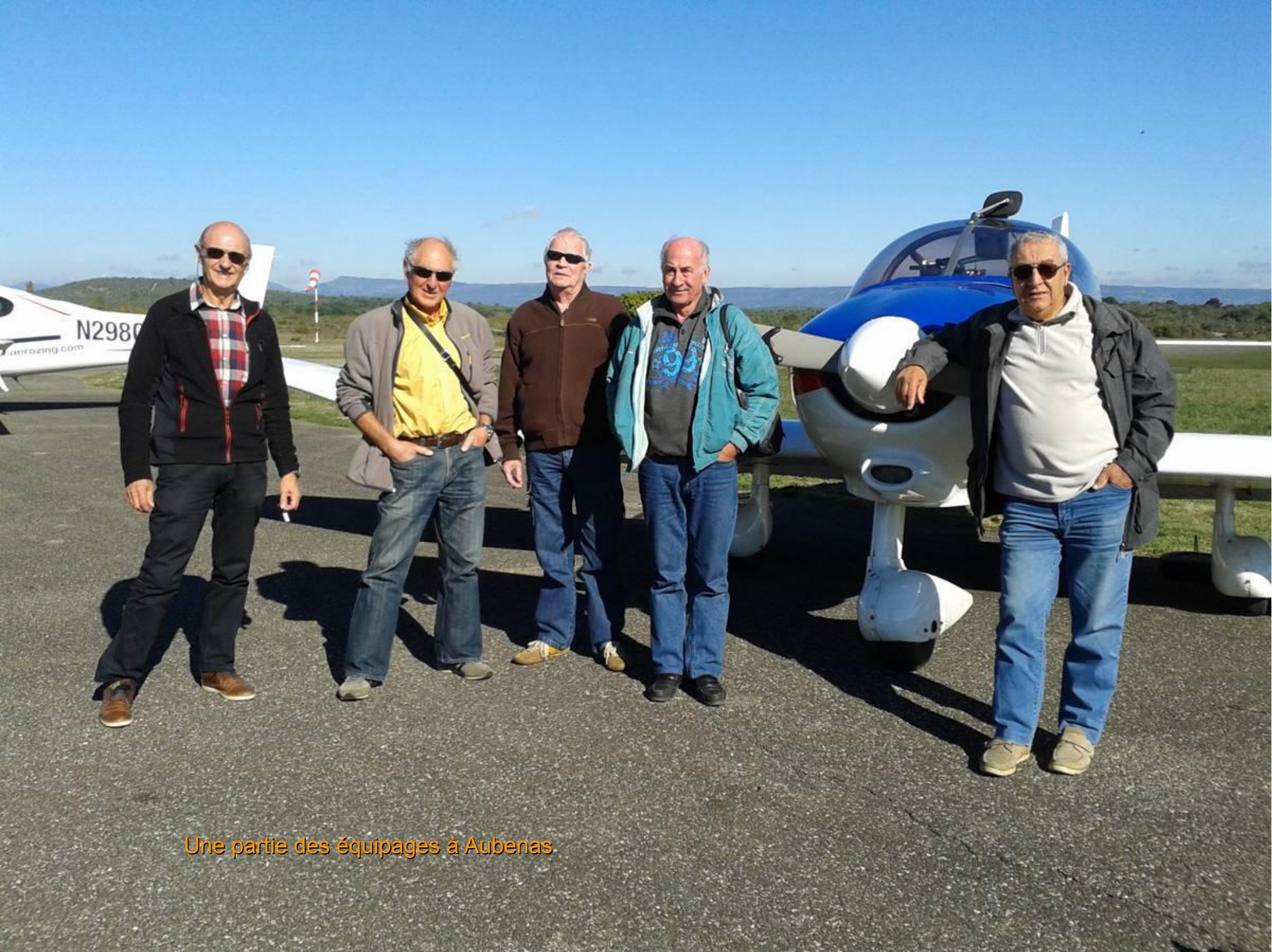
Une partie des équipages à Aubenas