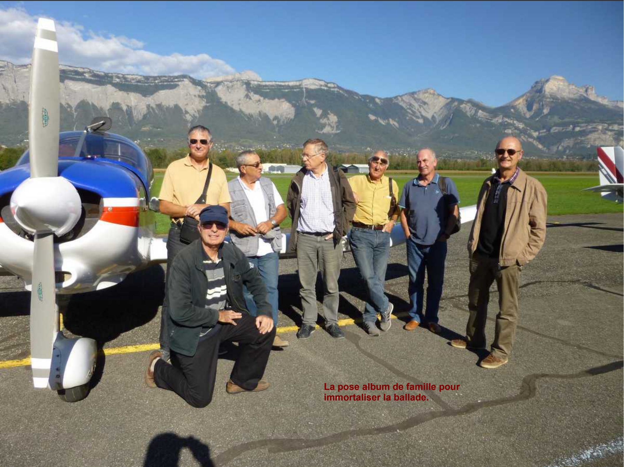
La pose album de famille pour immortaliser la ballade.