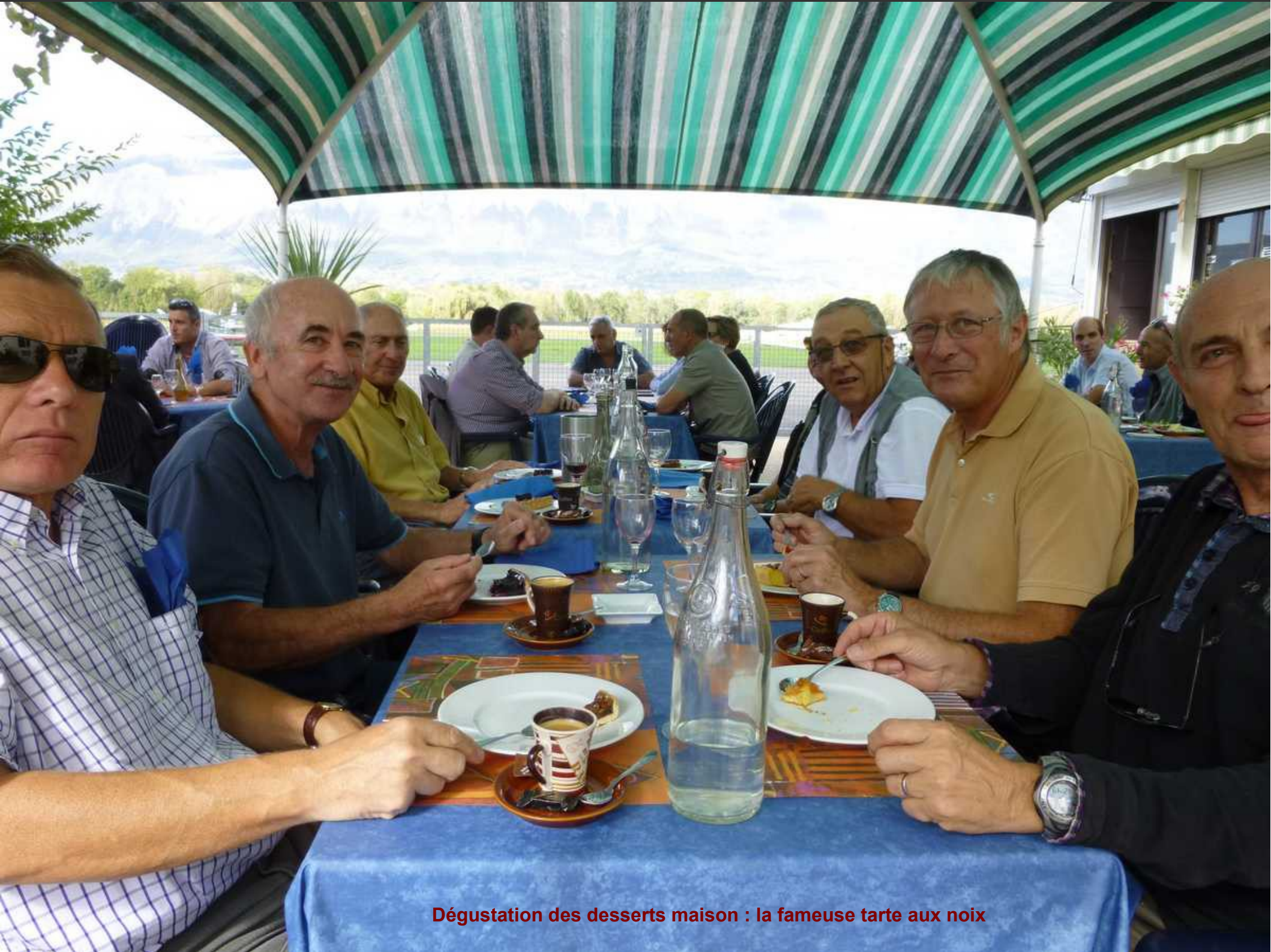
Dégustation des desserts maison : la fameuse tarte aux noix